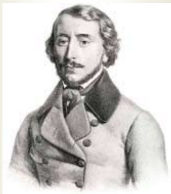
El barítono Felice Varesi

quien encarnó a Giorgio Germont en el estreno veneciano.