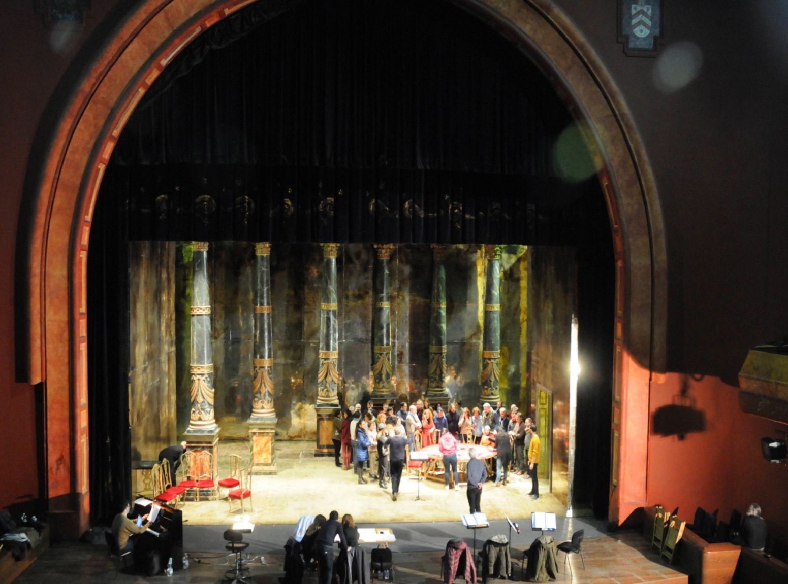
Tarde de ensayo de La Traviata -2017