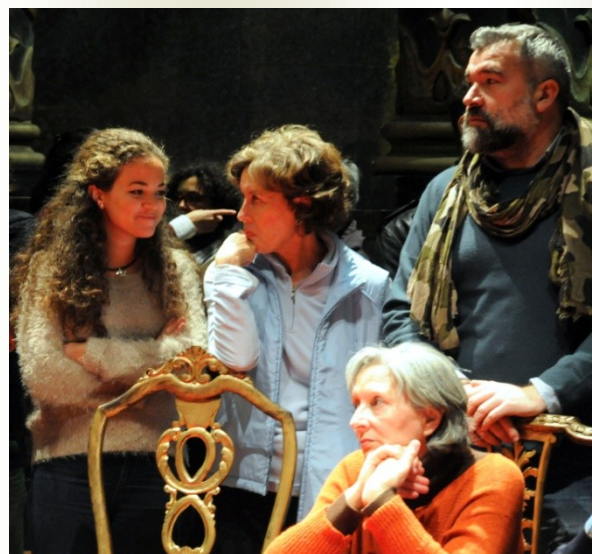
Miembros del Coro