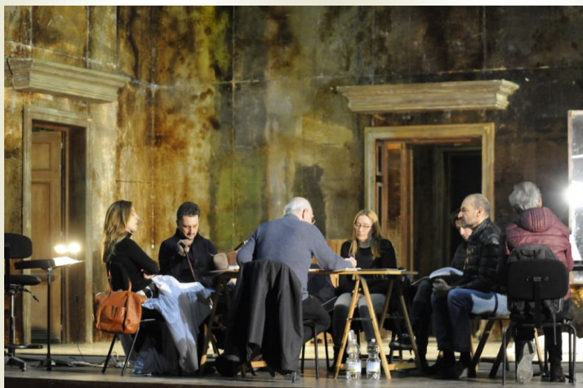
Los protagonistas reunidos con el Director de Escena